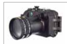
クローズアップレンズ 2 枚装着例