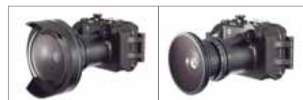
ワイドコンバージョンレンズ+ドームレンズユニット装着例

INON ワイドコンバージョンレンズ、ドームレンズユニット (別売) UWL-100 AchromatType2、ドームレンズユニット for UWL-100